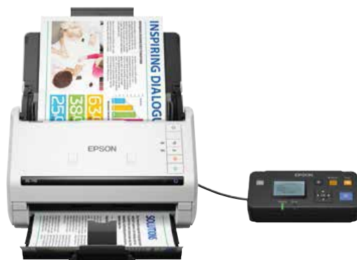
Escaneado en red requiere unidad de interfaz de red opcional.