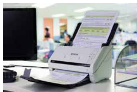
Adaptador para cama plana de escaneo opcional.