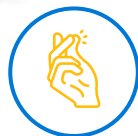
RAPIDEZ EN COLOCACION

Un equipo durable con diseño compacto y estético , adaptándose a cualquier entorno y mostrador. Resistente a cualquier tipo de uso.