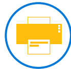
IMPRESOR TERMICO TICKET