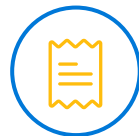
PAPEL 80MM DE ANCHO TICKET

Impresor térmico de papel continuo con una capacidad de ancho de papel de hasta 80mm y una velocidad de impresión de 200mm/seg. Ideal para alta demanda.